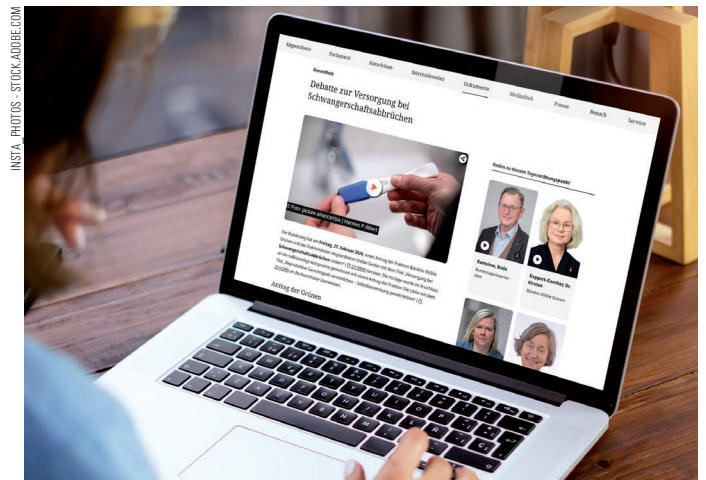
Fand kaum Beachtung: Debatte im Deutschen Bundestag

https://www.bundestag.de/dokumente/textarchiv/2026/kw09-de-schwangerschaftsabbrueche-1149764