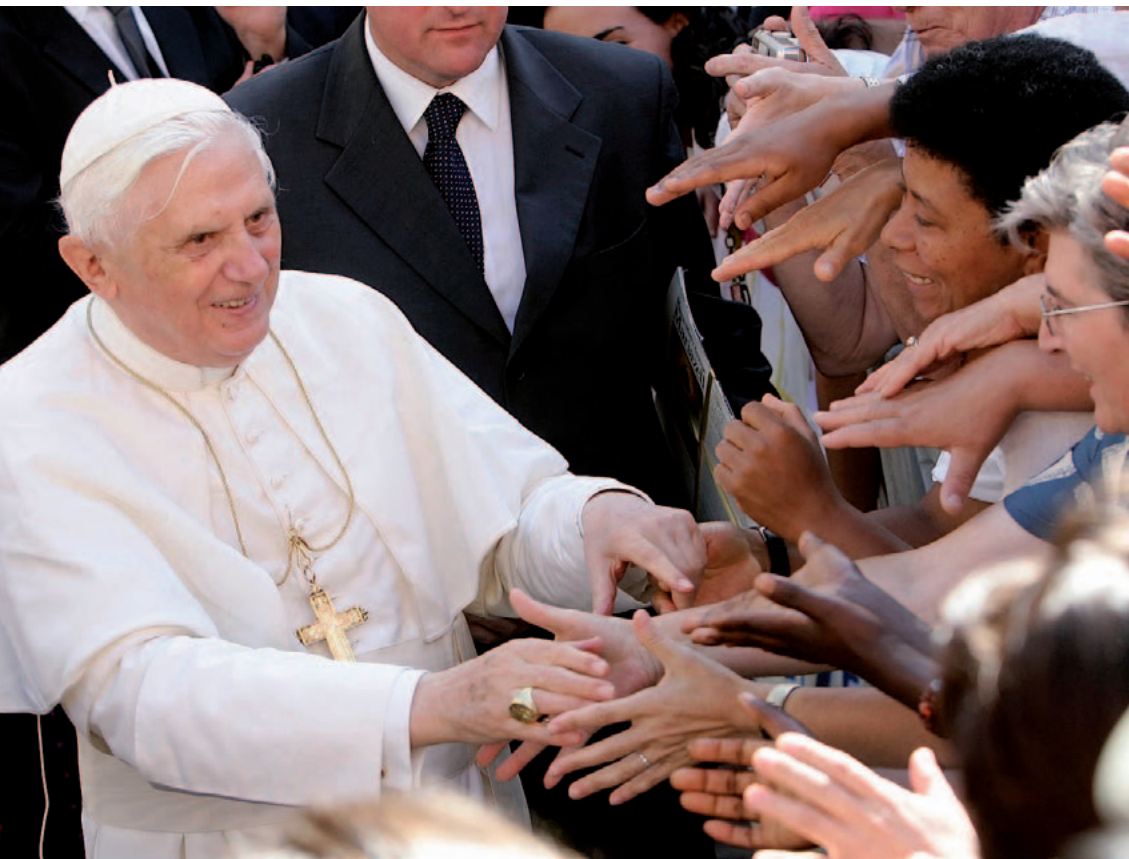
Papst Benedikt XVI. setzte sich unüberhörbar für den Schutz des Lebens ein.

Die deutsche und internationale Lebensschutzbewegung, die sehr stark christlich geprägt ist, hat Benedikt XVI. als einen herausragenden und richtungsweisenden Schutzpatron für die Menschenwürde und das Lebensrecht und für Jahrzehnte der Begleitung, Ermunterung und Bestärkung zu danken. Wir bleiben in tiefster Verehrung Benedikt XVI. als leuchtendes Vorbild im Einsatz für die in wachsendem Maße bedrohte Würde jedes Menschen verbunden.